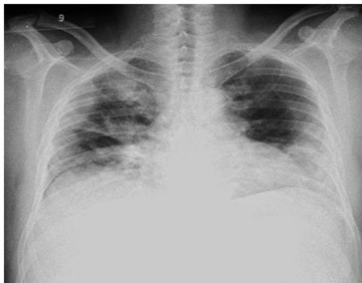
Fig. 2. Imagen que muestra radiopacidades difusas, con mayor cuantía en regiones hiliar y parahiliares.

Se recibieron los resultados de esputo BAAR con codificación 0, esputo bacteriológico negativo; así como hemocultivos I, II, III; exudado nasofaríngeo con flora normal; serología y VIH no reactivos, antígeno y anticuerpo virus hepatitis B y C, respectivamente también negativos.