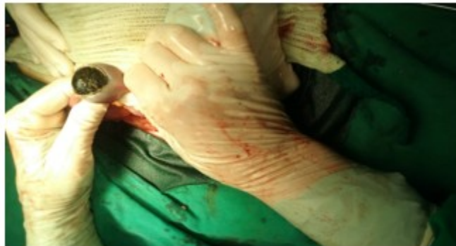
Foto 2. Momento que se realiza la extracción del cálculo