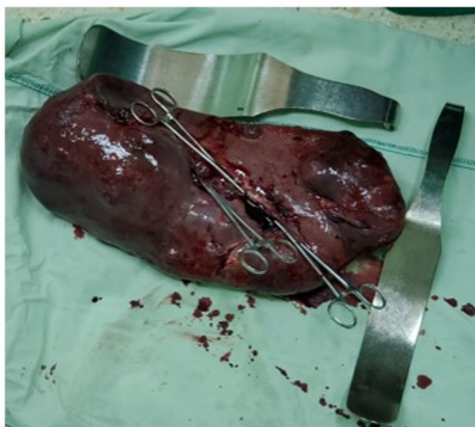
Fig. 3: Pieza quirúrgica. (Se observa la cara visceral del bazo)

El paciente se traslada a Unidad de Cuidados Intensivos Polivalentes, donde permanece por 48 horas. Se retira la sonda nasogástrica a las 24 horas y se comienza con dieta líquida. Se realizan exámenes complementarios posoperatorios resultando: hemoglobina 8,7 g/dL; hematocrito 0,29, amilasa sérica 43 UI/L y glicemia 5,6 mmol/L. Se traslada a la sala de Cirugía a las 48 horas, donde se retira el drenaje abdominal. Se realiza seguimiento por Hematología y por su evolución favorable se decide el alta hospitalaria al 5to día del posoperatorio. En la biopsia posoperatoria se informó bazo con dimensiones de 46x24x19 centímetros, compatible con enfermedad de Gaucher.