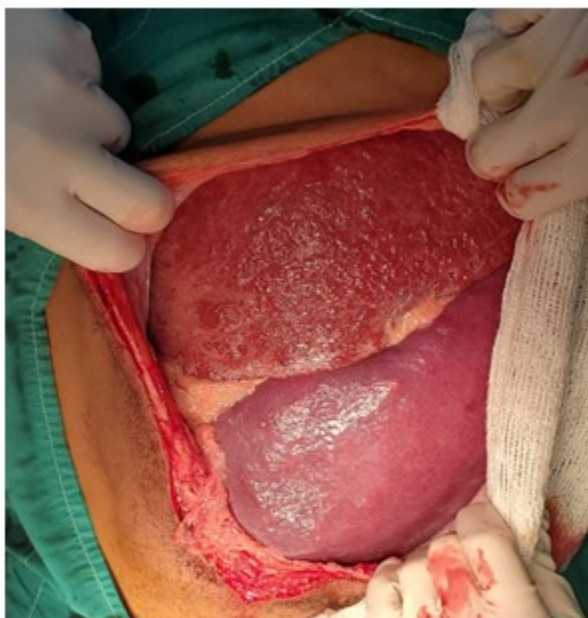
Fig.1: Hepatomegalia y esplenomegalia gigante, donde el bazo ocupa el hemiabdomen izquierdo e hipogastrio