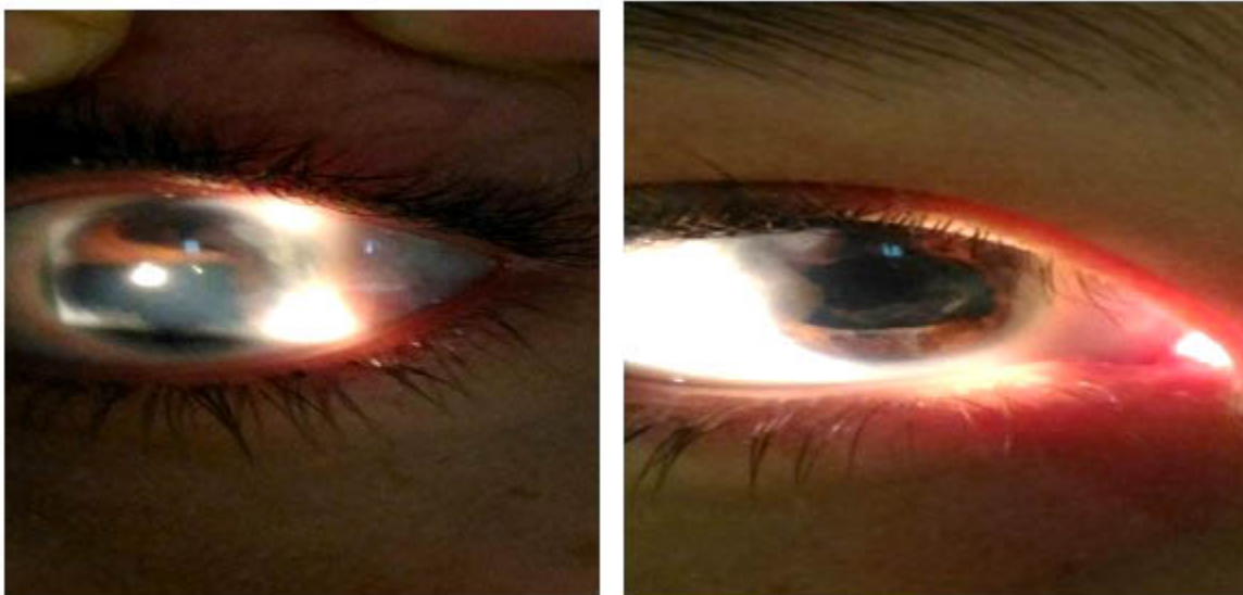
Fig. 1y 2. Imágenes de estudio biomicroscópico donde se observa deformidad de la pupila, áreas despigmentadas, varios orificios en el iris, embriotoxón posterior.

Examen físico ocular por biomicroscopía. (Fig. 1 y 2).