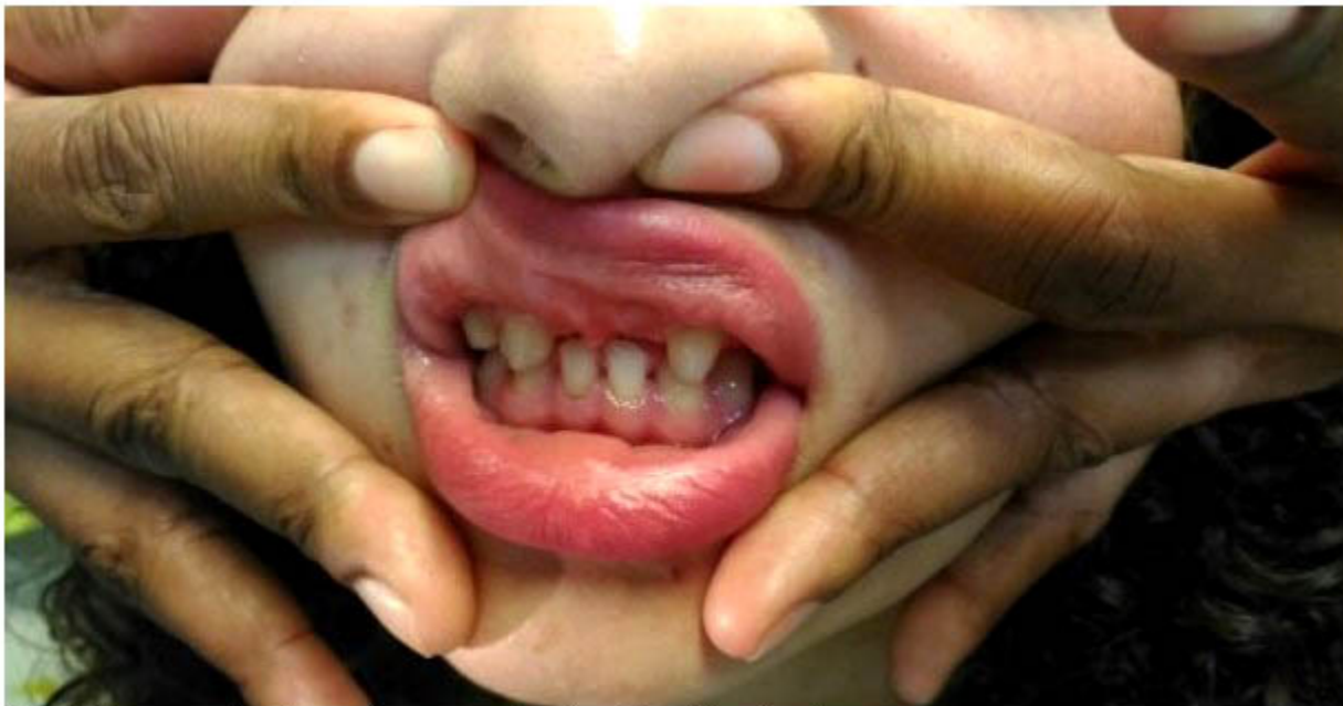
Fig. 8. Imagen donde se observa microdontia o hipodontia