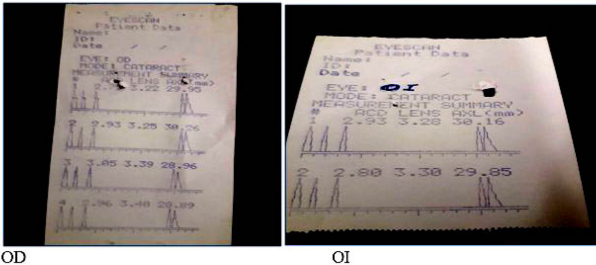
Fig. 5. Estudio biométrico.

Alteraciones no oculares: dismorfismo craneofacial leve, hipertelorismo, hipoplasia maxilar con aplanamiento del tercio medio facial,