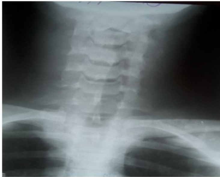
Fig. 2- Radiografía anteroposterior de la columna cervical, se observa desviación de la luz del esófago hacia la izquierda

En radiografía anteroposterior de tórax, se observó ensanchamiento del mediastino superior,