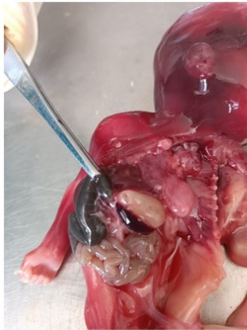
Fig.4. Imagen en que se observa atresia rectal.

El estudio anátomo-patológico se concluyó como sirenomelia grado VI con fémur y tibia únicos y ausencia de pies, acompañada de fusión de sacro con huesos ilíacos, agenesia de genitales