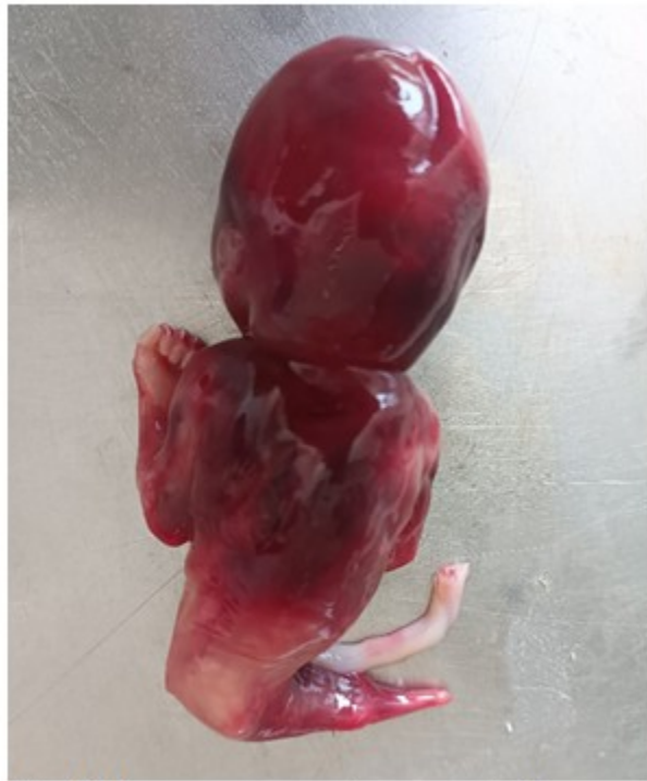
Fig. 2. Imagen que muestra ausencia de ano.