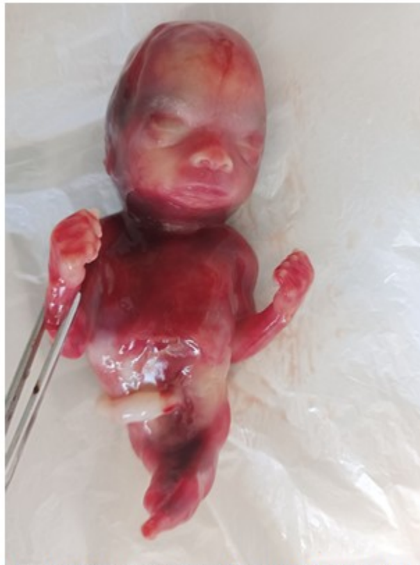
Fig. 1: Imagen en que se observa el fémur y tibia únicos con ausencia de pies. Ausencia de genitales externos.