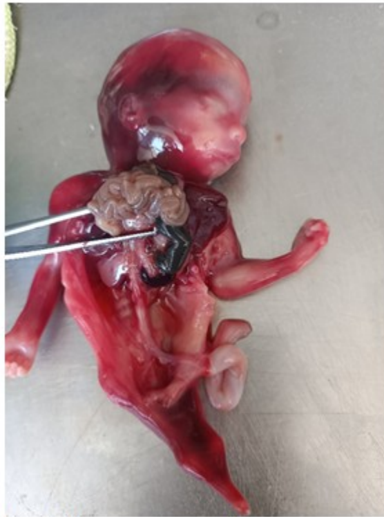
Fig. 3. Imagen en que se observa ausencia de riñones, suprarrenales, uréteres, vejiga, uretra y genitales internos.

A la disección por aparatos se encontró porción rectal carente de luz y terminando en un extremo ciego. (Fig. 4).