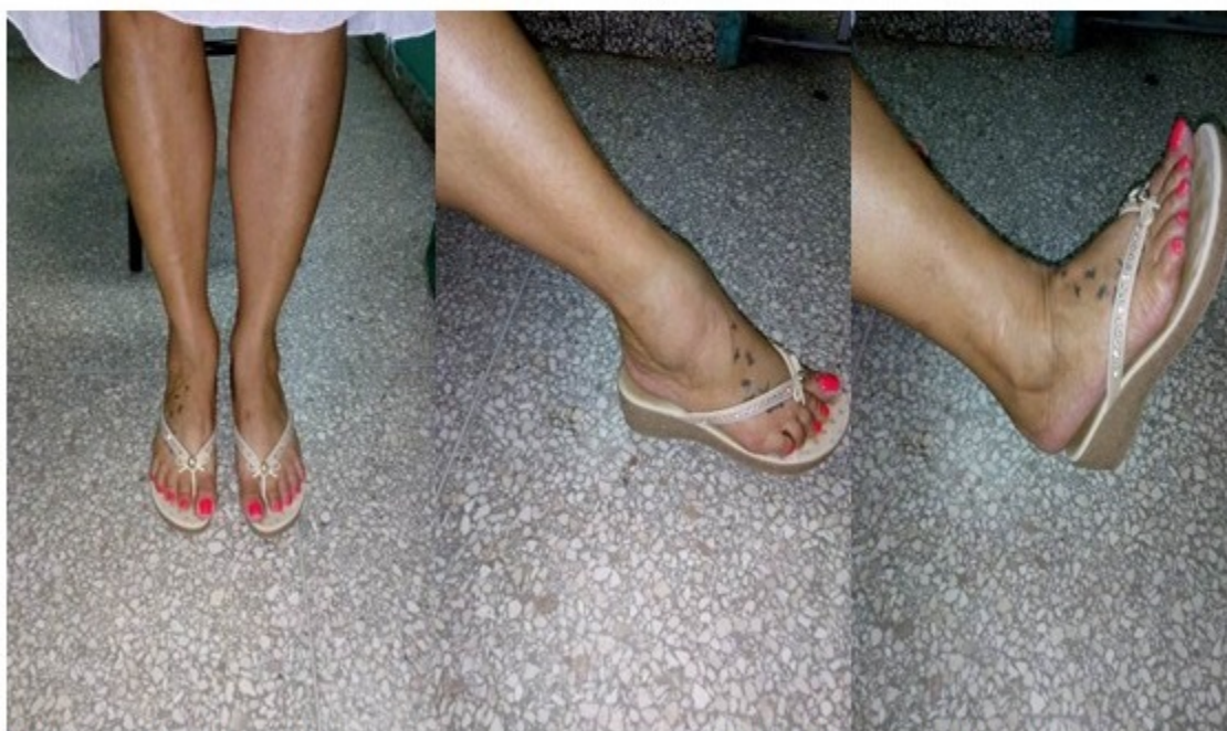
Figuras 12, 13 y 14. Imágenes que muestran el tobillo afectado a los cinco años de la cirugía.