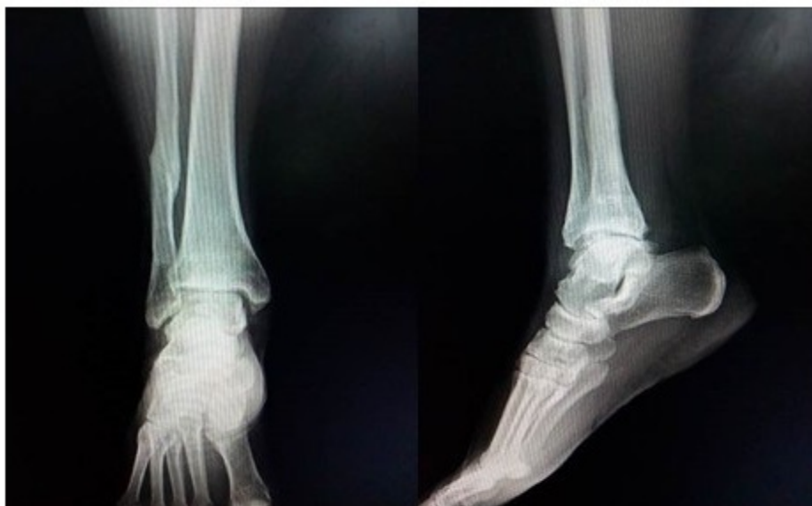
Fig. 10 y 11. Radiografías anteroposterior y lateral del tobillo a los cinco años de la cirugía.