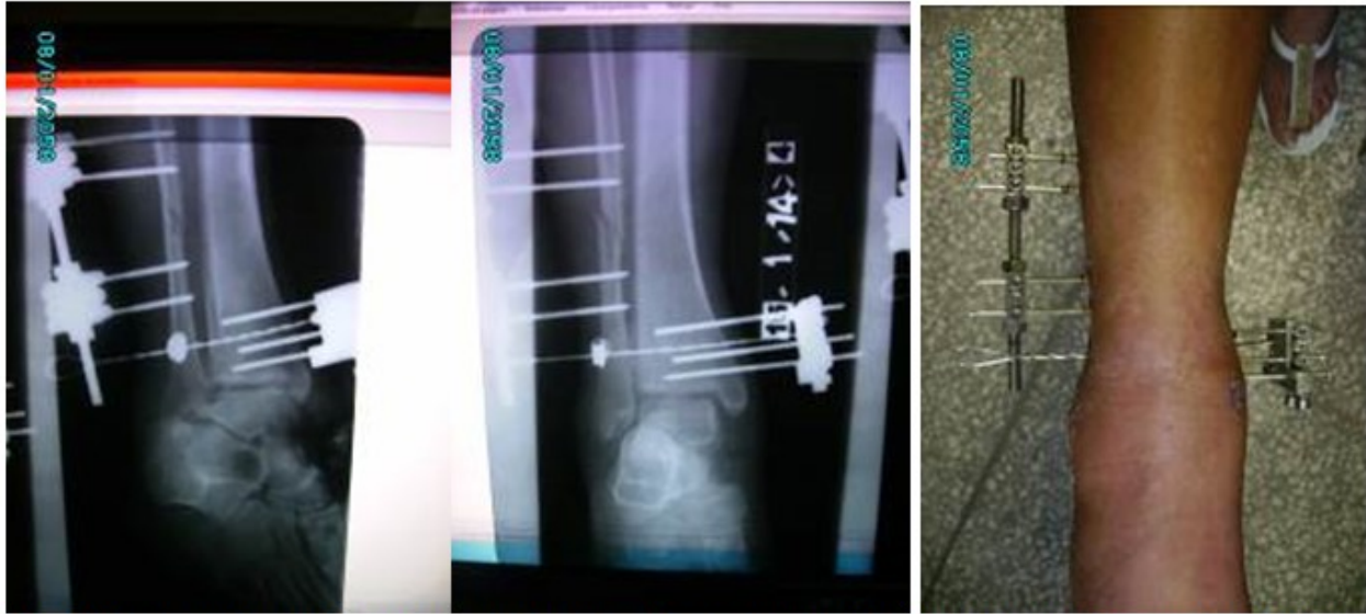
Fig. 7,8 y 9. Imágenes tomadas a los treinta días de la cirugía. Se muestran radiografías oblicua y anteroposterior del tobillo afectado y el aspecto del mismo con el fijador colocado.

intervención quirúrgica, en la misma se evaluaron las radiografías de control y se comprobó el estado del implante. Después de lo explicado se realizó un seguimiento mensual evaluándose los aspectos antes señalados en cada caso. (Fig. 7 a 9).