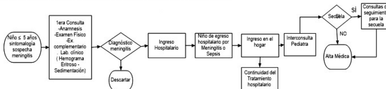
Figura 3. Diagrama de flujo del proceso de atención a un niño en edad preescolar con meningitis o sepsis de probable causa neumocócica.

En la Figura 3, se presenta el proceso de atención, en el nivel primario de salud, de un paciente con meningitis o sepsis de probable causa neumocócica.