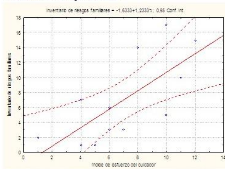
Gráfico 3. Relación entre el índice de esfuerzo del cuidador y el inventario de riesgos familiares

Finalmente, se observó una relación positiva entre el índice de esfuerzo del cuidador y el inventario de riesgos familiares. (Gráfico 3).