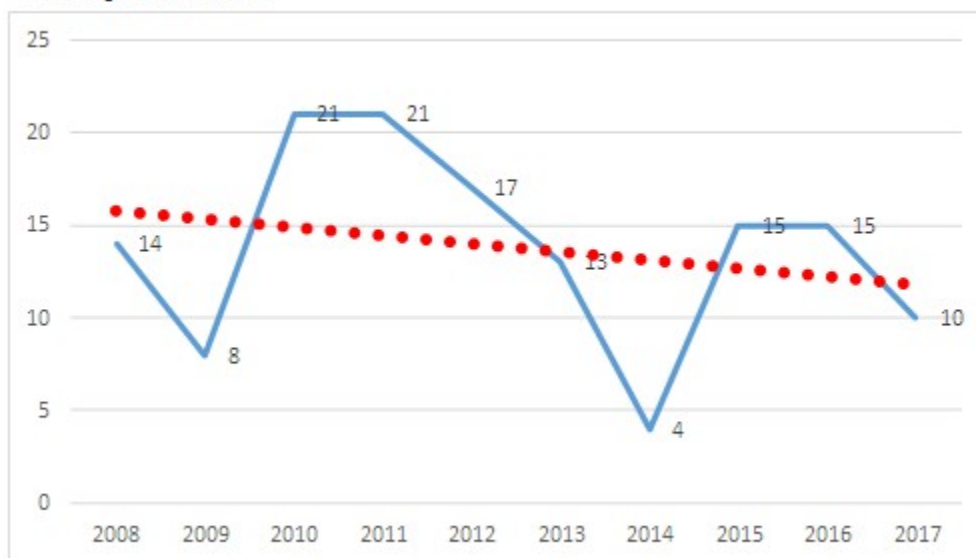
Gráfico 1. Prevalencia de malformaciones congénitas caridovasculares en Cienfuegos. 2006-2017

Fuente: Departamento de Estadísticas Salud Provincial. Cienfuegos