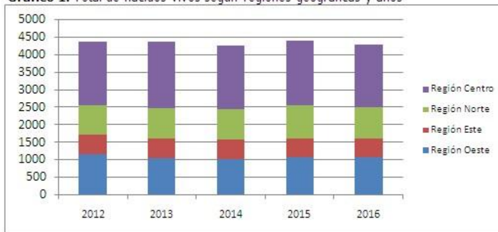
Gráfico 1. Total de nacidos vivos según regiones geográficas y años

Se observó una distribución heterogénea del porcentaje de positividad de la primera determinación (UMELISA TSH NEONATAL) según regiones geográficas y años. Las regiones oeste (1,87%), norte (1,34%) y este (1,33%) muestran los mayores valores de positividad que contrastan con los expuestos en la región centro