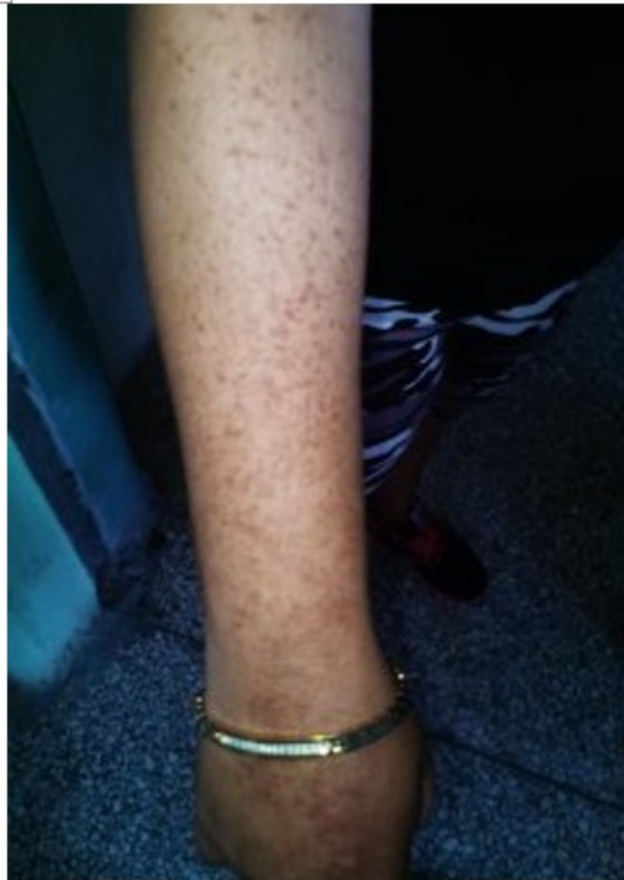
Figura 2. Máculas hiperpigmentadas puntiformes en miembro superior derecho al acudir a consulta.