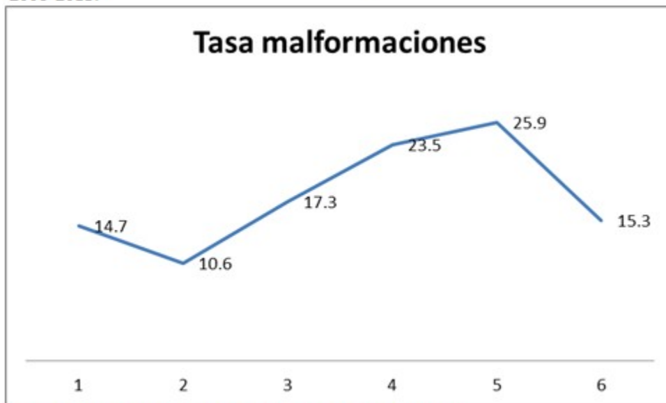
Gráfico 1. Prevalencia de malformados según años de estudio. Cienfuegos 2008-2013.

Fuente: Departamento de Estadísticas Salud Provincial.