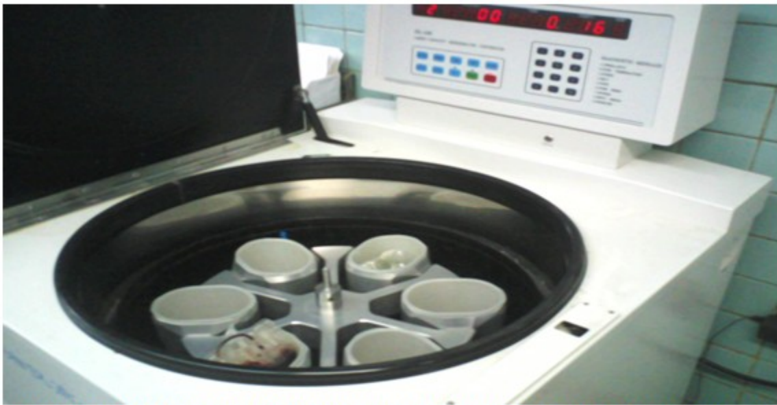
Figura 2. Centrifuga refrigerada marca DL 6M®, con la cual se realiza el proceso de centrifugación de los componentes sanguíneos para la obtención del PRP.