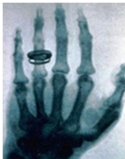
Figura 2. Radiografía tomada por Wilhelm Röntgen en 1896 a su esposa.

decidió entonces a practicar la prueba con humanos, la primera radiografía la realizó a su esposa. 1-3 (Figura 2).