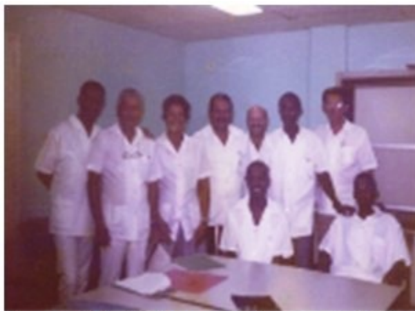
Figura 18. Profesores junto a estudiantes extranjeros al finalizar un examen práctico estatal.

(Figura 18), y cubanos, tanto de Cienfuegos como de otras provincias, pues se contaba con una gran cantidad de recursos humanos de la especialidad. En ese año comienzan a realizarse cursos de especialización o pos básicos de exámenes especiales de las provincias de Cienfuegos, Santiago de Cuba y Las Tunas, y hasta el 1993 se formaron 18 especialistas.