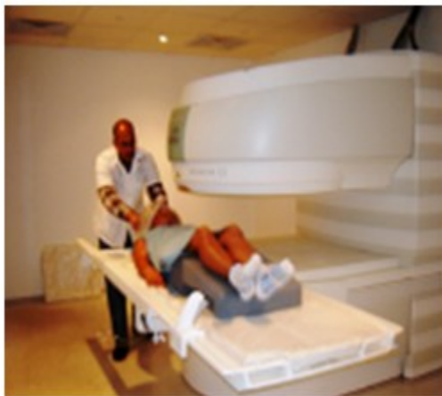
Figura 15. Equipo de resonancia magnética por imágenes (2007).