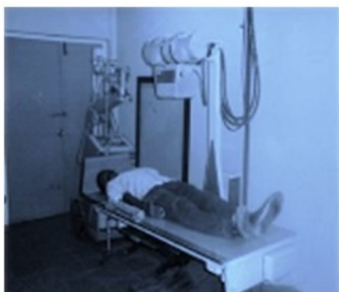
Figura 11. Equipo de rayos X convencional de Urología y equipo portátil (1979).