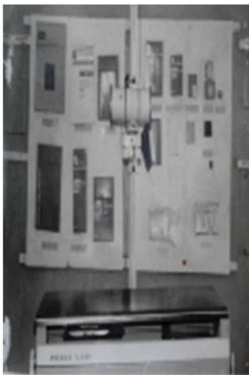
Figura 9. Equipo de rayos x convencional marca Picker.