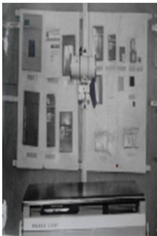
Figura 9. Equipo de rayos x convencional marca Picker.