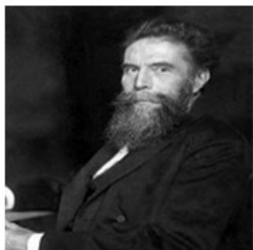
Figura 1. Wilhelm Conrad Röntgen (Alemania, 1845-1923).

El primer gran avance hacia el diagnóstico por la imagen, lo realizó Wilhelm Conrad Roentgen en 1895 (Figura 1); profesor de física teórica y rector de la Universidad de Wurzburg, Alemania, descubrió los rayos X el 8 de Noviembre de 1895. Al no contar con conocimientos de medicina, necesitó siete semanas de trabajo intenso para redactar la célebre comunicación Sobre una nueva especie de radiaciones . 1-3