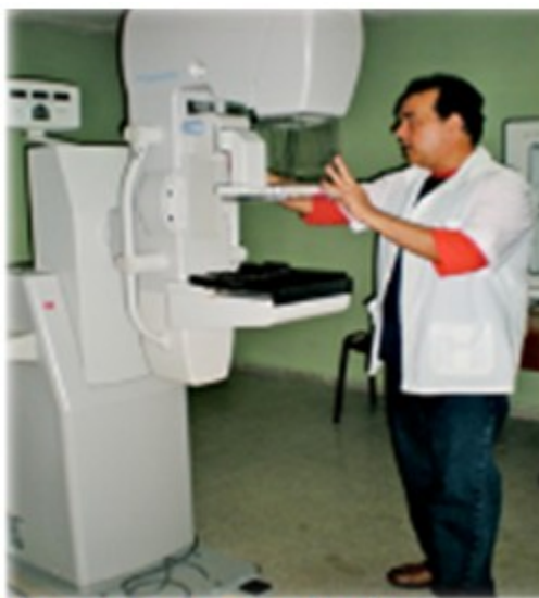
Figura 16. Equipo mamógrafo.

Inicialmente surge el policlínico Área I, nombrado José Luís Chaviano Chávez, situado en la calle Arango entre San Fernando y San Carlos. Inaugurado en 1966, comienza a funcionar como Policlínico Integral contando ya con equipo de rayos x Marca Phillips. En la actualidad ocupa una nueva edificación, situada en calle 25 entre 46 y 48 y cuenta con equipo de rayos X convencional marca Shimadzo. En 1971 surge el