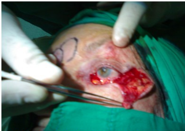
Figura 3. Imagen que muestra la exéresis del tumor en el párpado inferior izquierdo.