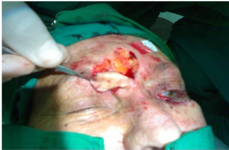
Figura 2. Imagen que muestra la exéresis del tumor en el párpado superior derecho.