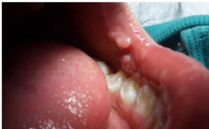
Figura 1. Lesiones papulomatosas a nivel de mucosa oral de los carrillos.

Al examen dermatológico de la cavidad bucal, se encontraron múltiples pápulas ovaladas, con tendencia a agruparse, diseminadas en toda la cavidad bucal y en la lengua, del color de la mucosa oral, de consistencia blanda, de superficie lisa y brillante, de 0,3 mm a 1 cm, no dolorosas. (Figura 1, figura 2 y figura 3).