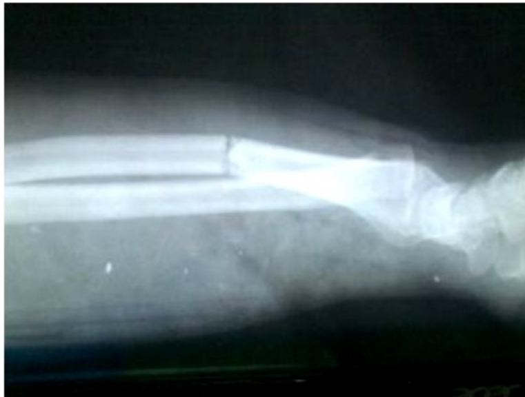
Figura 2. Imagen radiográfica lateral en la que se aprecia la angulación dorsal del radio así como la disyunción radio-cubital distal a los 45 días de la lesión.

Ya en consulta, a los 55 días de la lesión, se le orientó otra radiografía. (Figura 3).