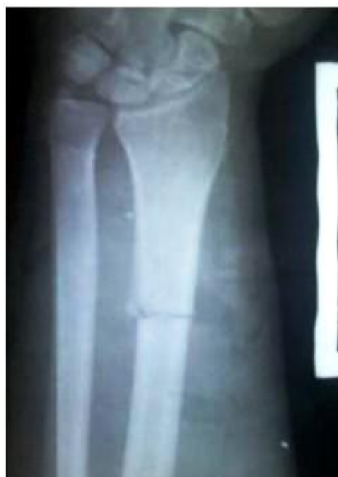
Figura 1. Imagen radiográfica anteroposterior que muestra fractura transversal a nivel de la unión del tercio medio y distal del radio sin signos de consolidación a los 45 días de la lesión, con disyunción radio-cubital distal.

El paciente mostró dos radiografías realizadas a los 45 de la lesión en las que se observó: una fractura transversal sin consolidar (Figura 1) y angulación dorsal del radio así como la disyunción radio-cubital distal (Figura 2).