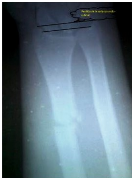
Figura 3. Imagen que muestra la fractura-luxación a los 55 días de evolución, donde es evidente la pérdida de la varianza rodio-cubital.

Ya en consulta, a los 55 días de la lesión, se le orientó otra radiografía. (Figura 3).