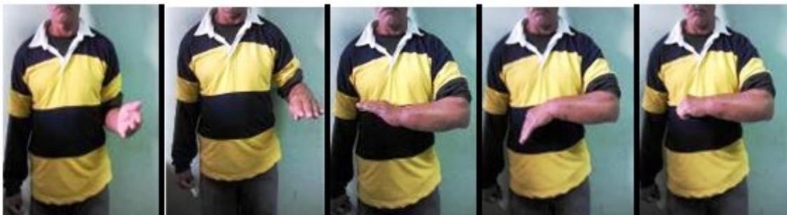
Figuras 5 a 9. Imágenes que muestran el resultado a los cinco meses