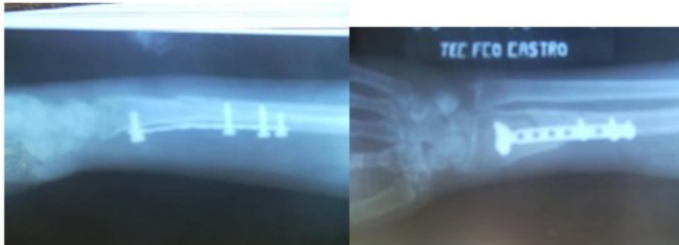
Figuras 7 y 8. Radiografías a las seis semanas de operada.

paciente se incorporó a su vida habitual y a su trabajo de oficina. Se le dio de alta con una función completa de la articulación de la muñeca. (Figuras 7,8, 9,10,11 ).