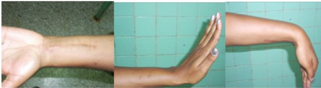
Figuras 9, 10 y 11. Imágenes donde se pueden observar la cicatriz de la operación y los puntos donde estuvo el minifijador, además de la función de flexión dorsal y palmar de la mano, a las diez semanas de operada.