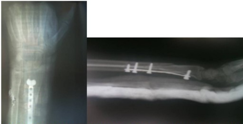
Figuras 5 y 6. Radiografías anteroposterior y lateral a las cuatro semanas de operada que muestran la férula ante braquial.

A las seis semanas después de retirada la férula antebraquial se indicó fisioterapia a la paciente para rehabilitación. A las diez semanas la