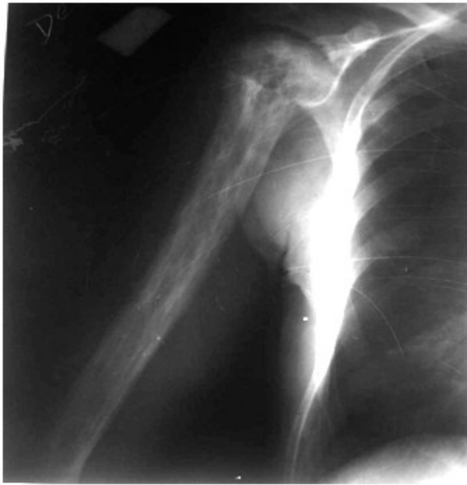
Figura 1. Radiografía simple de húmero derecho, anteroposterior, donde se observa alteración de la estructura ósea que compromete todo el hueso, caracterizada por expansión ósea, engrosamiento cortical y trabecular. Destaca a nivel de epífisis humeral una extensa área radiolúcida, marginada por esclerosis.

La radiografía comparativa del miembro contralateral fue negativa. (Figura 2).