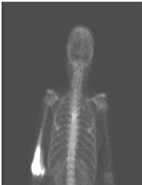
Figura 4. Gammagrafía ósea donde se muestra un intenso depósito patológico del trazador bien delimitado y manteniendo la estructura anatómica del húmero, compatible con probable enfermedad de Paget monostótica derecha.

Se realizó estudio ultrasonográfico abdominal que se informó sin alteración de los órganos macizos.