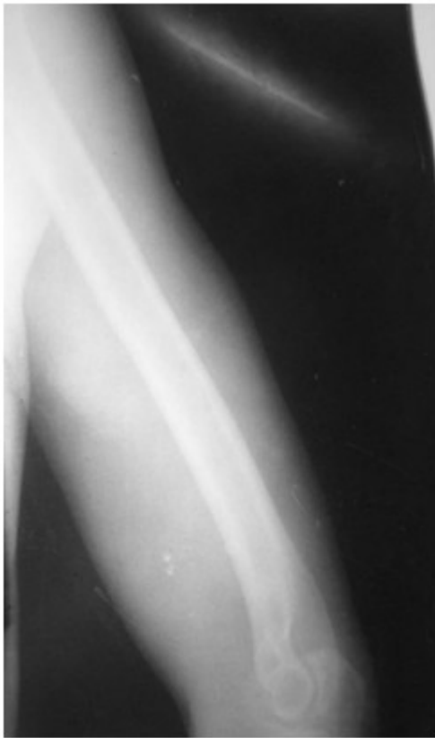
Figura 2. Radiografía del húmero contralateral.

Debido al antecedente del paciente y el resultado de las radiografías se decidió su ingreso para realizar estudios hemoquímicos, los cuales arrojaron resultados dentro de límites normales, excepto la fosfatasa alcalina sérica que alcanzó cifras elevadas de 1790 mmol/l.