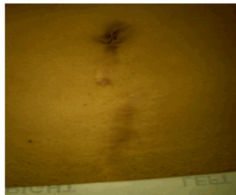
Figura 1. Imagen que muestra cicatriz media infraumbilical de la cesárea anterior.

Abdomen: presencia de cicatriz media infraumbilical que en su medio presenta un tumor de aproximadamente 4 cm, doloroso a la palpación superficial y profunda e irreducible. (Figura 1).