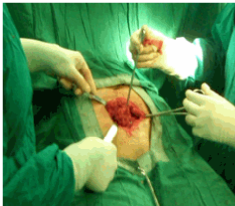
Figura 2. Momento de la operación donde se está realizando la excéresis del endometrioma.

mm X 40 mm de color rosa pálido, que toma la aponeurosis, de consistencia sólida. (Figuras 2 y 3).