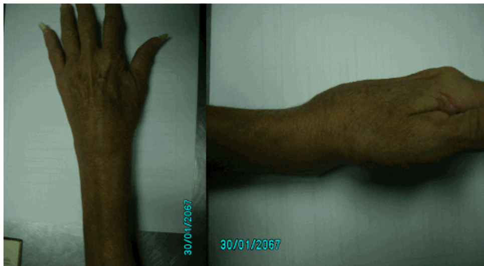
Figuras 1 y 2. Aspecto de la mano afectada en que se observa lo llamativo de la deformidad marcada del extremo distal del radio.

Era llamativo el aspecto de la muñeca afectada, pues se constató una deformidad en su cara dorsal, con signo de los radiales visible en la vista anteroposterior. (Figuras 1 y 2).