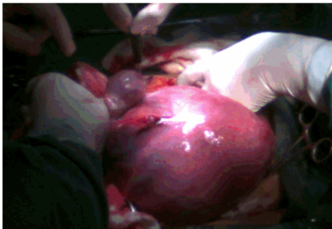
Figura 2. Imagen que muestra el tamaño del útero de aspecto fibromatoso y con mioma.

Hubo de realizarse una amplia incisión para poder extraer el fibromioma. (Figura 3).