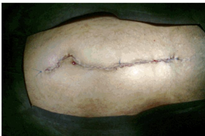
Figura 3. Imagen que muestra la incisión suturada.

Hubo de realizarse una amplia incisión para poder extraer el fibromioma. (Figura 3).